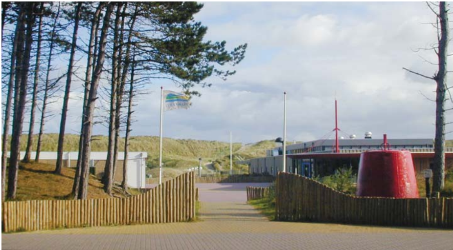
In het bosgebied links van de ingang van het Kampeerterein wil de SRV de trekkershutten plaatsen